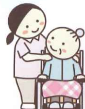
コミュニケーション補助