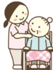
コミュニケーション補助